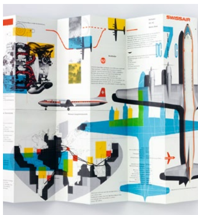
Kurt Wirth, Faltprospekt, DC-7C Vorderseite, Swissair, 1956