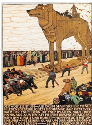
Burkhard Mangold, Umzugsanzeige Wolfensberger, 1909