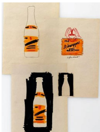
Reinhard Morscher, Entwürfe für Schweppes, 1974