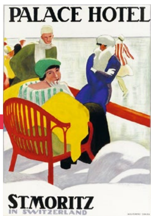
Emile Cardinaux, Plakat Palace Hotel St. Moritz, 1920